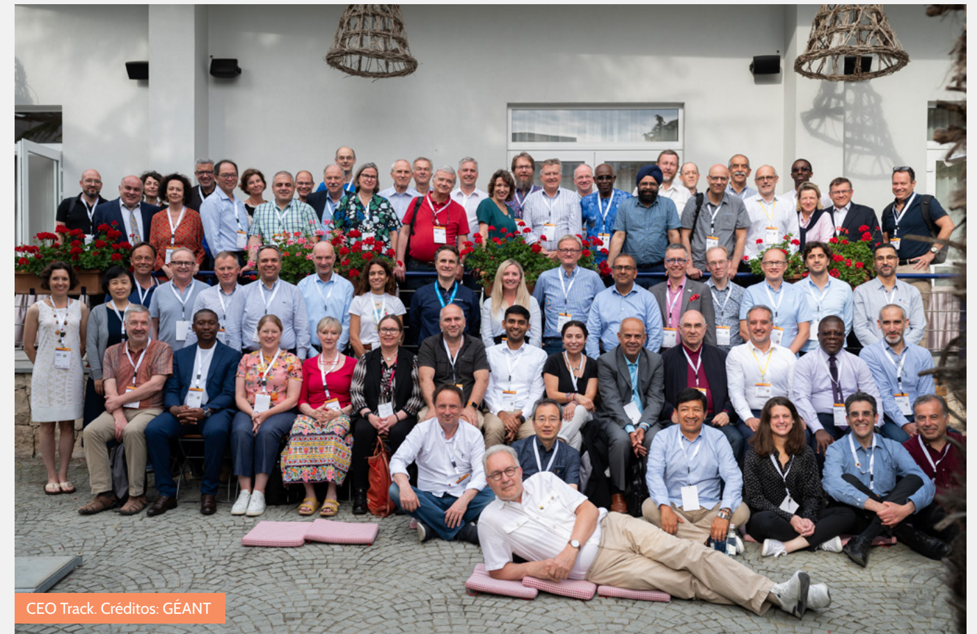
CEO Track.